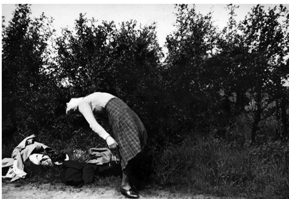
► Figure 8 : Sans Titre , série Incidental Gestures , 33 x 48 cm, 2011-2012. Avec l'aimable autorisation de l'artiste.

À l'inverse de ces retouches réparatrices, qui adoucissent ou neutralisent l'horreur de l'image d'origine, l'intervention dans la visualité de l'archive peut aussi s'effectuer de manière à suggérer une menace, une catastrophe en suspens ou une intensité morbide qui ne s'y trouvait pas forcément au départ. L'Attachée (2011) montre ainsi une jeune femme debout sous une corde à linge mais qui semble faire face à un peloton d'exécution ; dans Glanz (2012), une autre jeune femme, malgré sa pose élégante sur fond d'intérieur bourgeois, a les yeux curieusement cernés d'un mort-vivant. D'autres images produisent une curieuse impression de déséquilibre ou présentent une dynamique insolite qui semble résulter de l'effacement d'un élément essentiel de l'image source, comme cette femme projetée en arrière sous l'effet d'une invisible déflagration dans une des vues de la série Incidental Gestures (2011-2012).