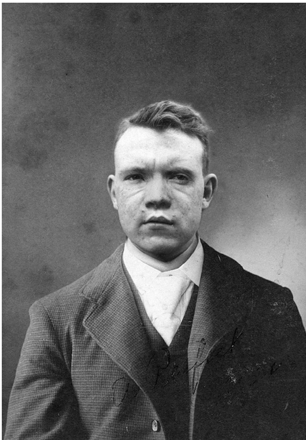
► Figure 6 : Gueule cassée , 30 x 34 cm, 2011.