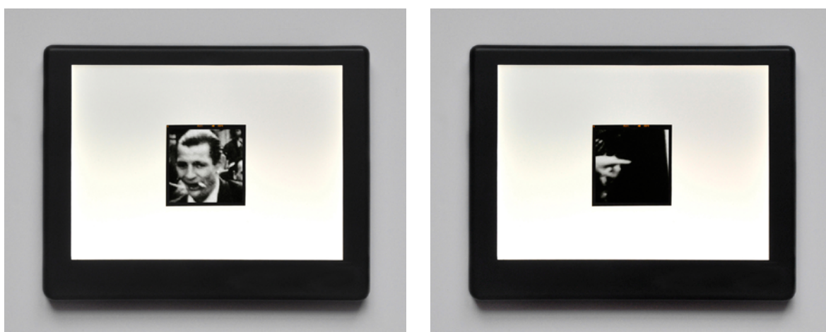
► Figures 1 et 2 : 13 fragments (extrait), diapositives 6 x 6 cm sur caisson lumineux, 20 x 15 cm, 2014.

Schématiquement, l'artiste s'empare de l'archive de trois manières différentes, éventuellement combinées dans une même série ou un même accrochage. La première manière relève de la sélection iconographique : certaines images sont montrées telles quelles, dans une version rephotographiée ou scannée et transférée sur un nouveau support, comme dans Flying man (2015), projection sous forme de diapositives de 80 photogrammes extraits d'un film de 1912 montrant la chute fatale d'un homme qui saute depuis la tour Eiffel équipé d'une combinaison-parachute.