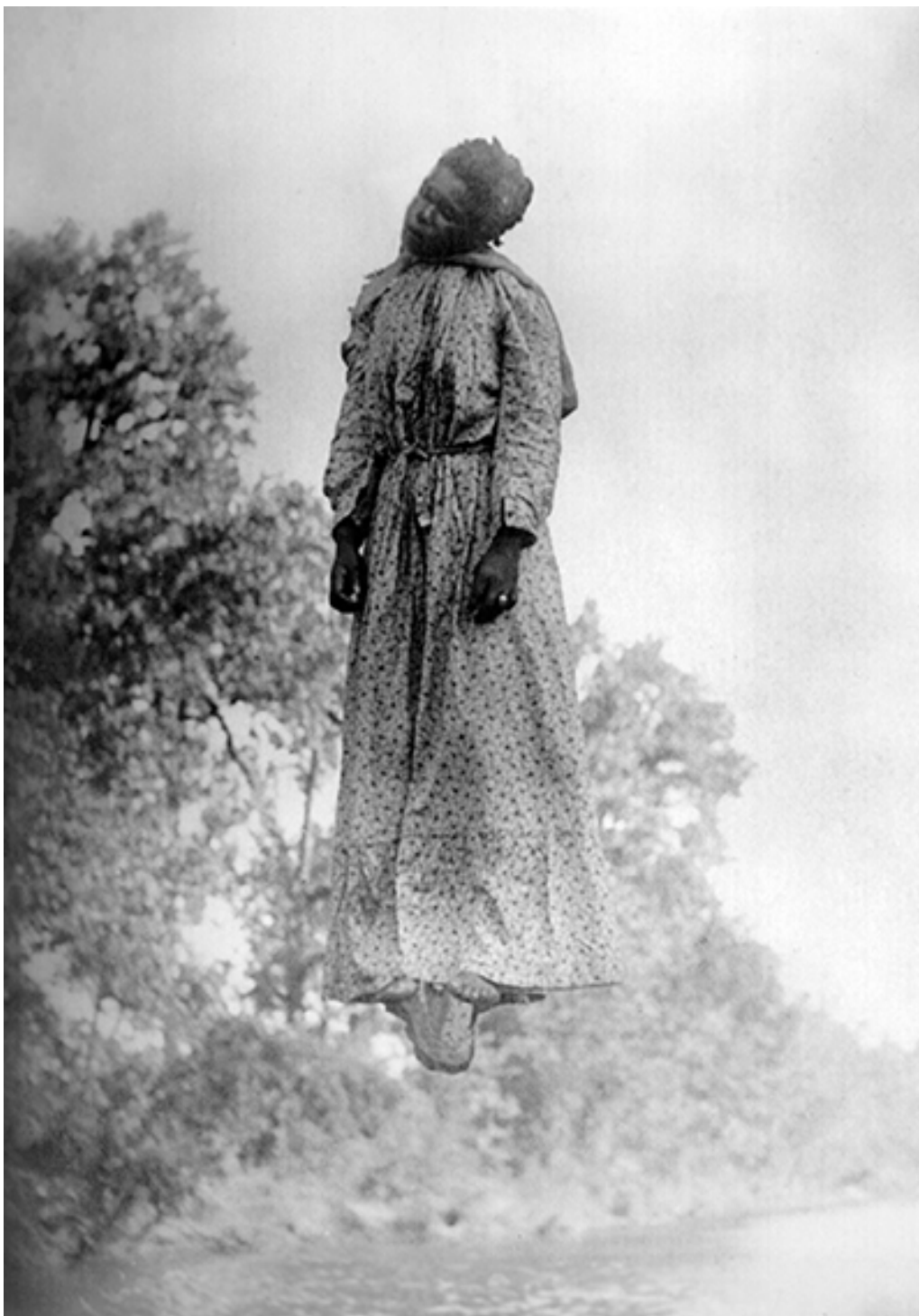
➤ Figure 7 : Laura Nelson , 22 x 16 cm, 2011.