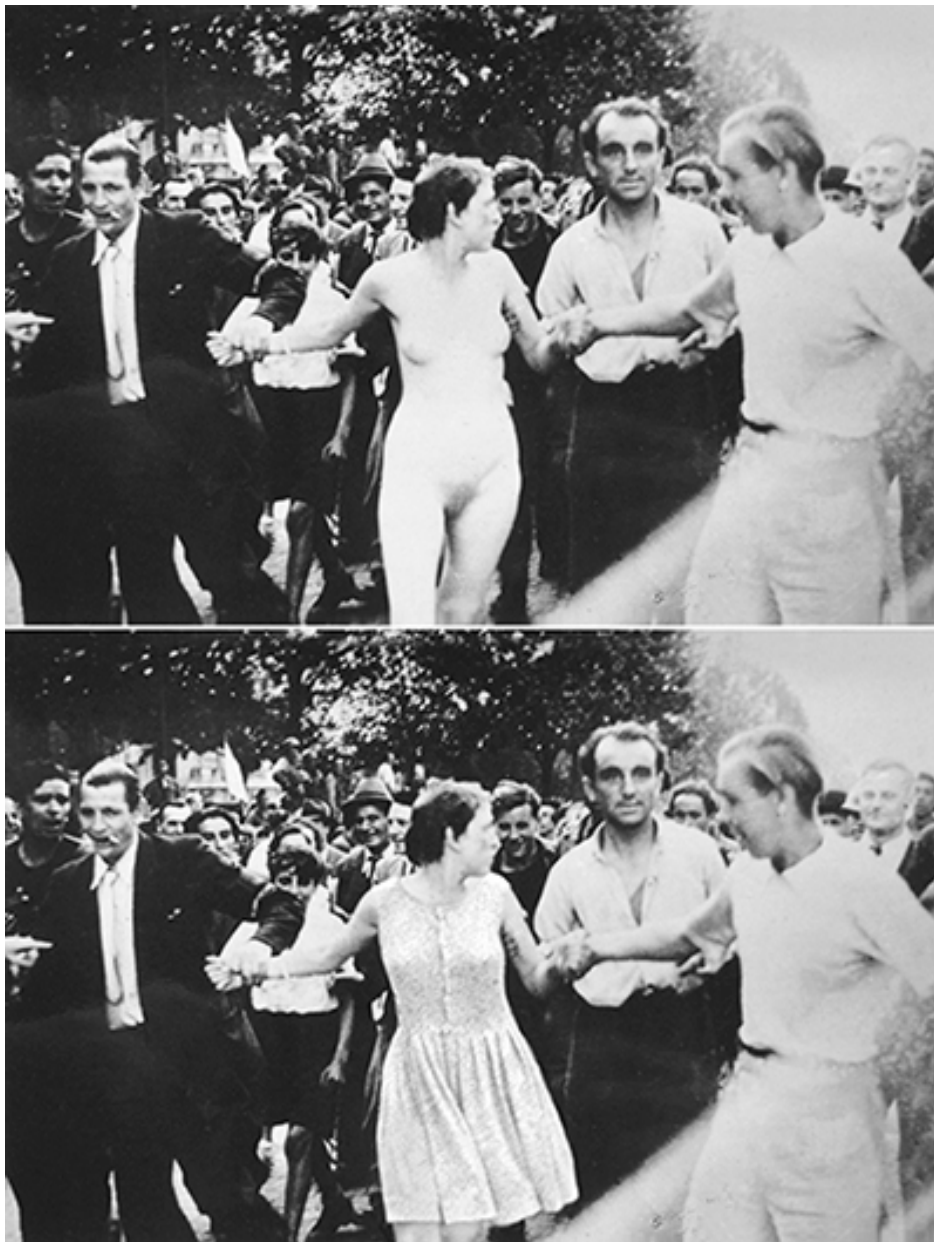
➤ Figure 5 : Libération , diptyque, 22 x 34 cm, 2011.

L'intervention de l'artiste peut aussi consister, de manière beaucoup plus intrusive, en une transformation de l'image d'origine. Libération (2011) est un diptyque juxtaposant l'image exploitée dans 13 fragments de la jeune femme nue désignée à la vindicte publique et une version largement retouchée de l'archive, où la même jeune femme apparaît habillée d'une robe blanche. Ailleurs, Agnès Geoffray redonne un visage à un soldat défiguré de la Grande Guerre ( Gueule cassée , 2011). Ailleurs encore, elle efface la corde à laquelle pend le cadavre d'une femme noire ( Laura Nelson , 2011), transformant une victime célèbre de l'Amérique raciste en un corps en lévitation.