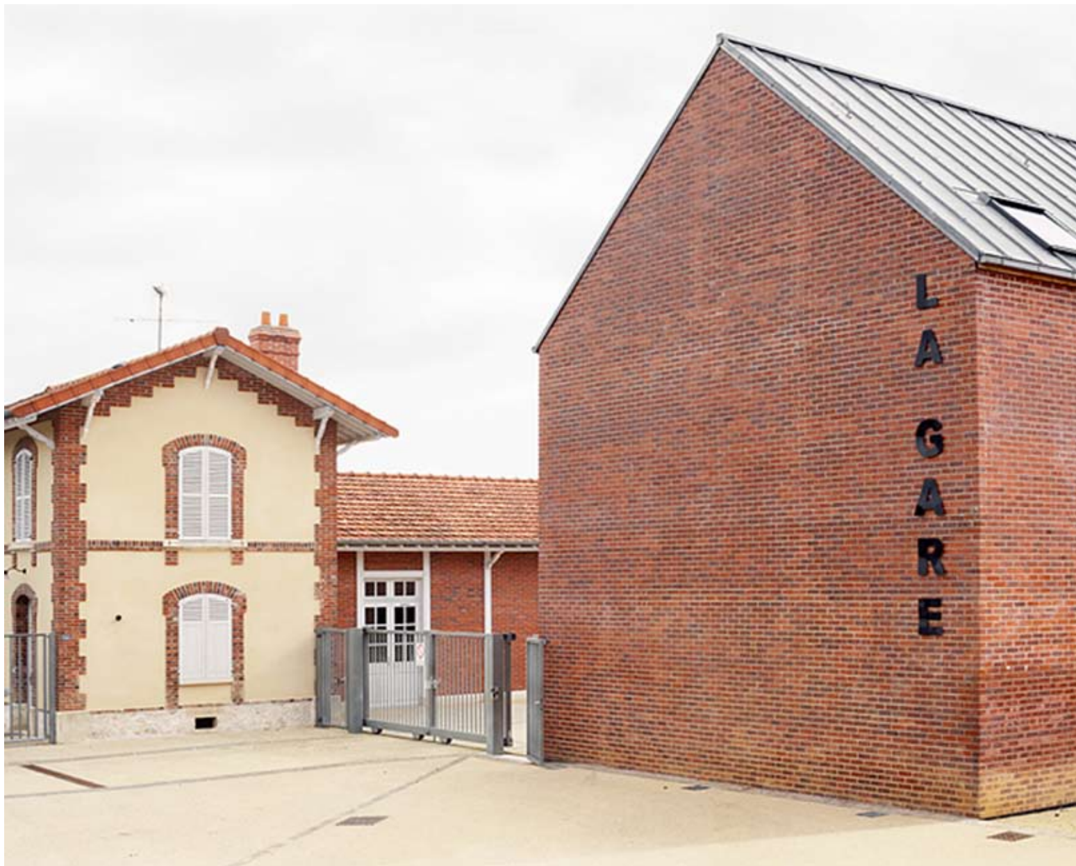
Pascal Mougin, Amilly-fiction , 2009, série de 18 photographies couleur, tirages encres pigmentaires, 60 x 75 cm.