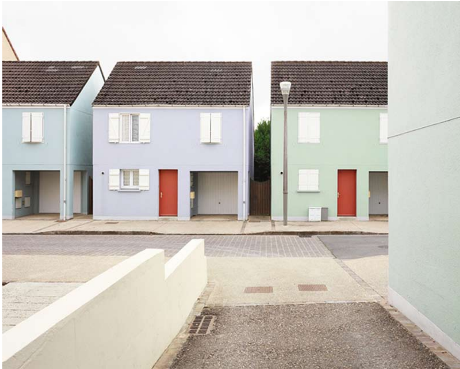
Pascal Mougin, Amilly-fiction , 2009, série de 18 photographies couleur, tirages encres pigmentaires, 60 x 75 cm.