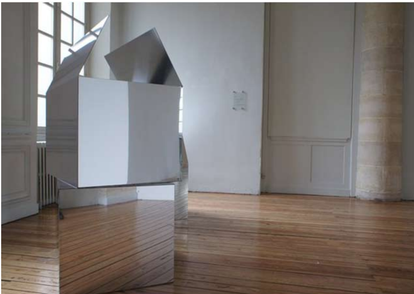
Bernard Calet, Construction , 2011, série de cinq sculptures en dibon miroir.