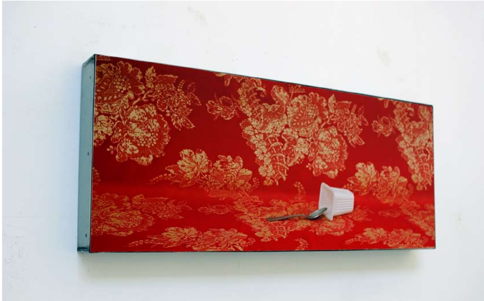
Bruno Saulay, J'aimerais que les filles voient , photographie, texte : Pina Bauersch, 2009, 80 x 33,3 cm.