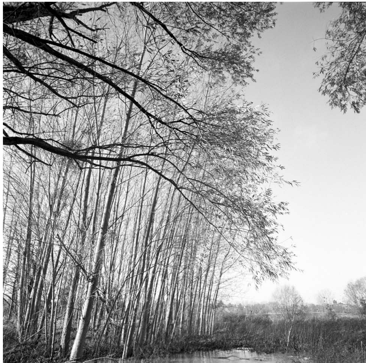
Jacqueline Salmon, Eaux sauvages, eaux domptées , commande de la ville d'Amilly série de photographies noir et blanc, 2000.