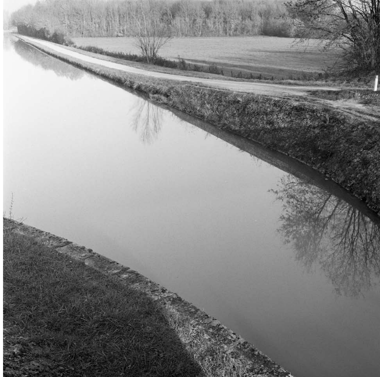
Jacqueline Salmon, Eaux sauvages, eaux domptées , commande de la ville d'Amilly série de photographies noir et blanc, 2000.