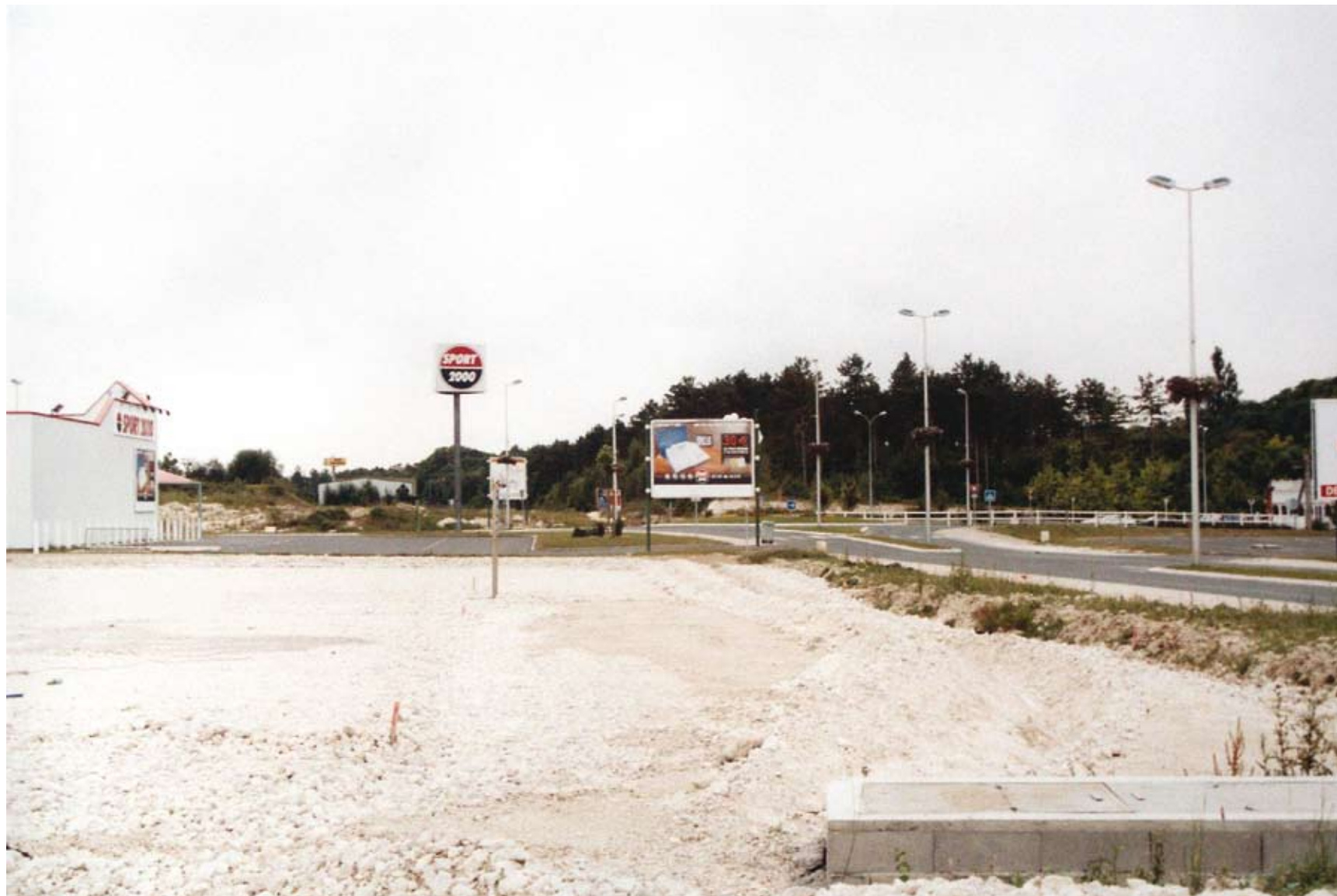
Thibaut Cuisset, Regard sur le territoire amillois : paysages-ruptures , 2004, photographie.